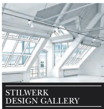
STILWERK DESIGN GALLERY